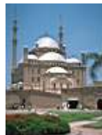
Mohamed Ali Moschee